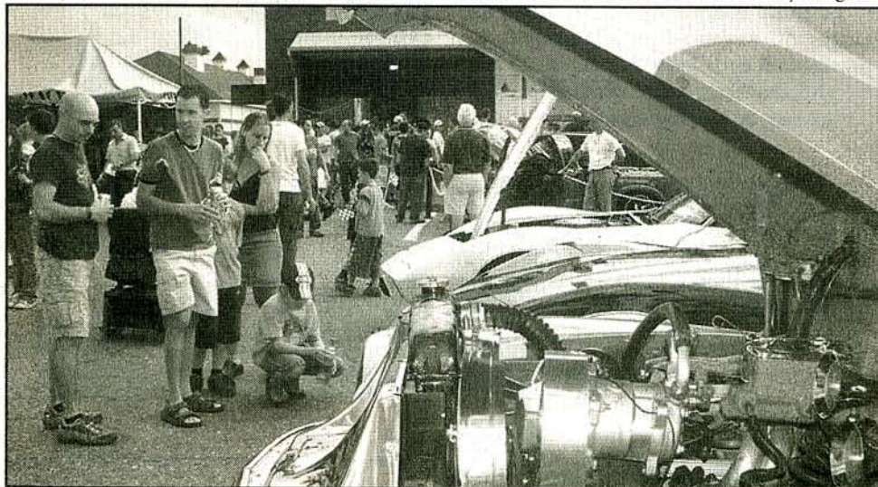
Plusieurs visiteurs se sont arrêtés pour admirer les voitures inscrites au "Show n' shine", l'un des nombreux événements du Coaticook Auto Moto Show.

Néanmoins, le comité organisateur croit que tous les visiteurs ont apprécié leur visite à l'événement. Les préparatifs pour le 5e Coaticook Auto Moto Show vont déjà bon train.